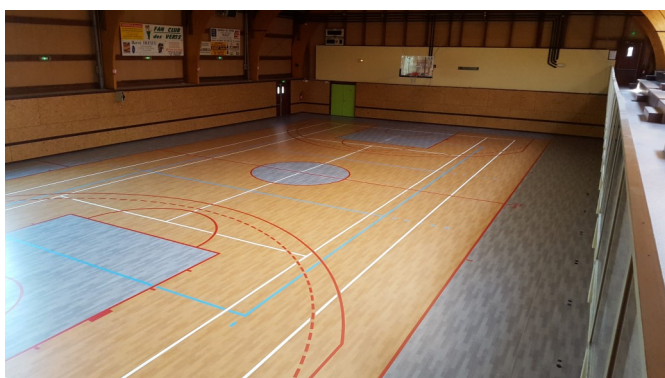
Changement du sol de la salle polyvalente