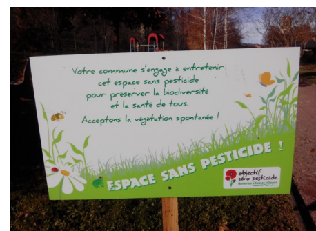
2 panneaux sont installés aux entrées nord et sud du City stade

La préservation de l'environnement nous concerne tous.