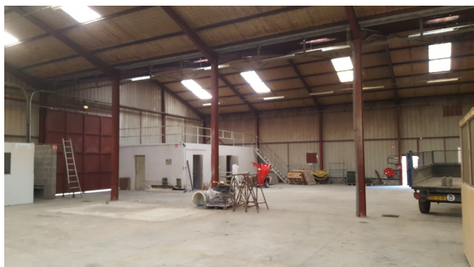
Achat et aménagement sur le site « Ramberton » d'un local de 600 m 2 destiné à regrouper l'ensemble des services techniques