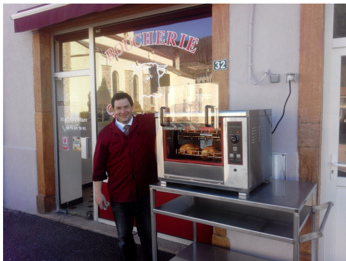
Achat d'une rôtissoire pour la boucherie