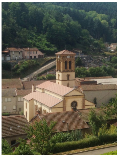
Réfection du toit de l'église