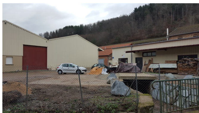
Installation des Artisans sur le site rénové de « Ramberton »