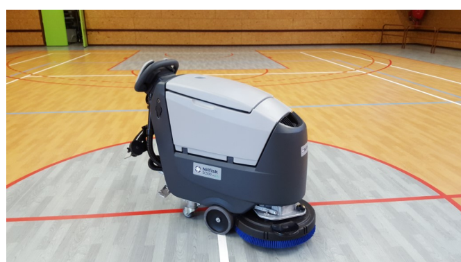
Changement de la laveuse de la salle polyvalente

Installation de plaques de rues numérotées